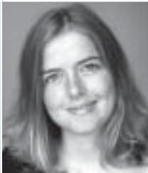
Simon Ammitzbøll Det Radikale Venstre