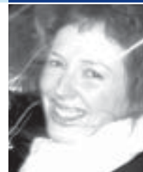
Paula Le Dieu Creative Commons

Meget tyder på, at det bliver et konkurrenceparameter at engagere brugerne og lade dem sætte deres præg på fremtidens medier. Creative Archive og Backstage er BBCs to mest ambitiøse initiativer hertil, hvor publikum inviteres indenfor og får næsten frie tøjler til at lege med BBCs indhold på nye og kreative måder – hvad enten det drejer sig om den britiske kulturarv eller BBCs software. Kom og hør kræfterne bag fortælle om de erfaringer, hindringer og udfordringer, der er kommet ud af det.