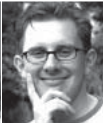
Mogens Jensen Socialdemokraterne